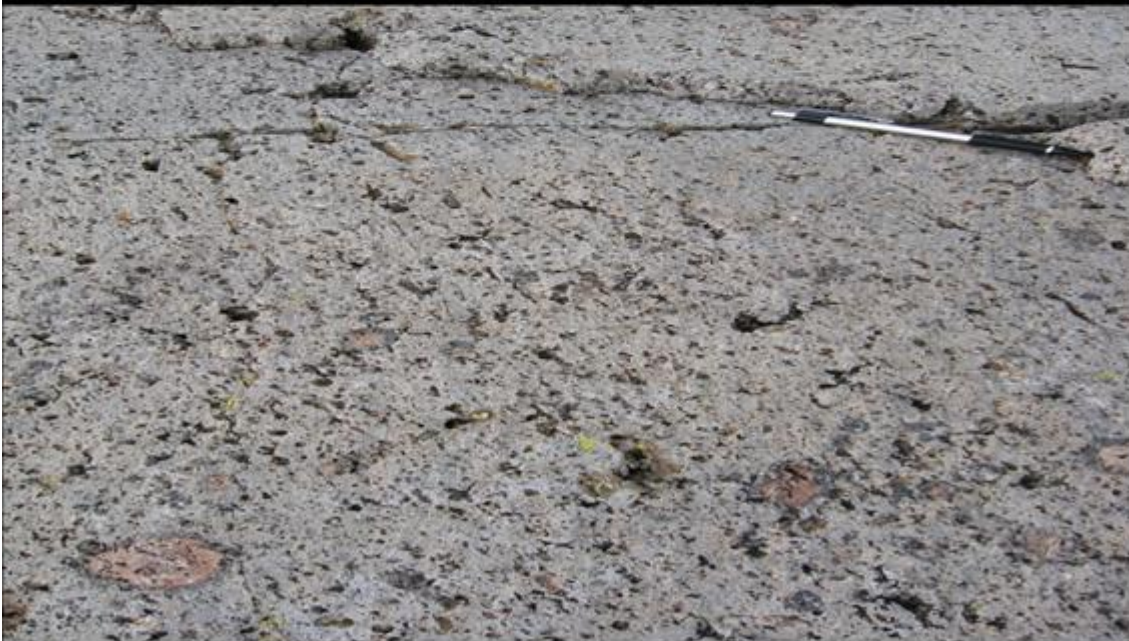
En la superficie de la roca, en la que se identifican esferulitas de feldespato potásico de aproximadamente un centímetro de diámetro.