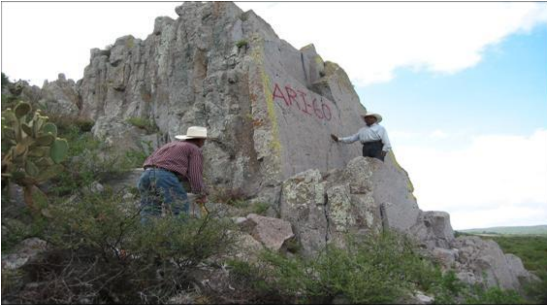
Prospecto El Picachito. Afloramiento de traquitas localizado al sureste de Villa de Arista.